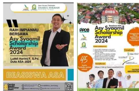
Gambar 14. Beasiswa ASA