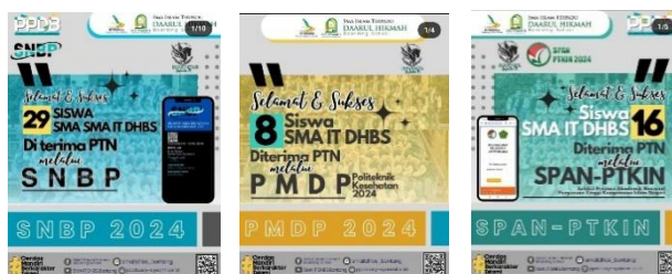
Gambar 12. Lolos dalam SNBP, PMDP dan SPAN-PTKIN