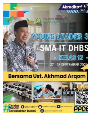
Gambar 15. Kegiatan Young Leader