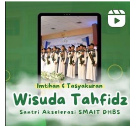
Gambar 13. Kegiatan wisuda Tahfidz