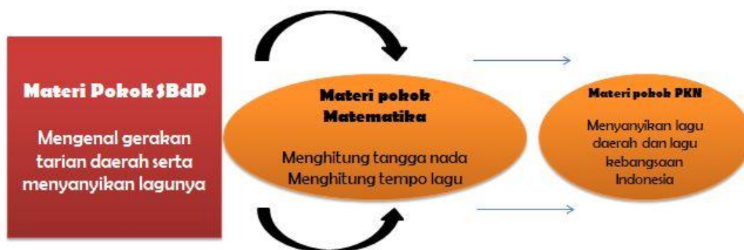
Gambar 2. Materi pokok kelas IV MI/SD yang berbasis integrasi interkoneksi

Materi pokok kelas IV MI/SD yang berbasis integrasi interkoneksi berarti menggabungkan dan mengaitkan materi pokok SBDP dengan mata pelajaran yang lainnya seperti pada materi menyanyikan lagu daerah dapat dikaitkan dengan mata pelajaran matematika tentang mengenal nada dan tempo lagu dan bisa juga dikaitkan dengan mata pelajaran pkn tentang menyanyikan lagu daerah indonesia yang mana melaksanakan kewajiban sebagai warga Negara Indonesia. Upaya ini mengharuskan poin penting dalam dengan memberikan kemampuan logis, reflektif, kritis, kreatif dan metakognitif yang merupakan kemampuan berpikir tingkat tinggi.